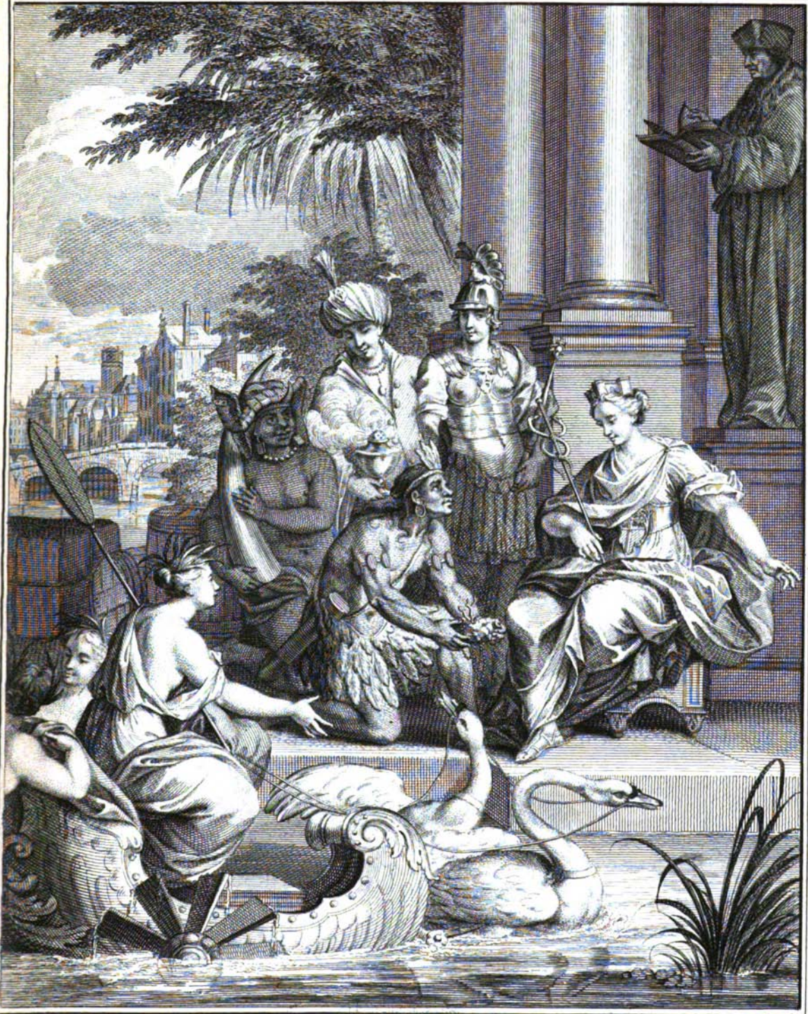
J. P. de Witte sculpit. 1750.