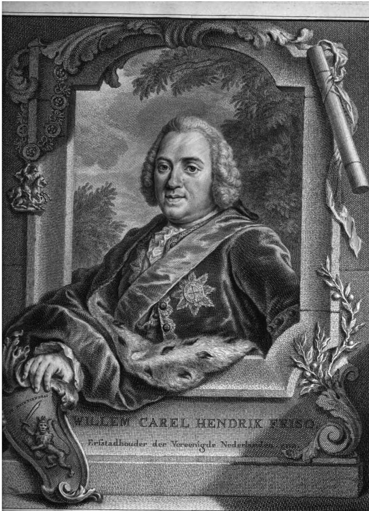
WILLEM CAREL HENDRIK KUISIN Eerstehouder der Vereenigde Nederlanden