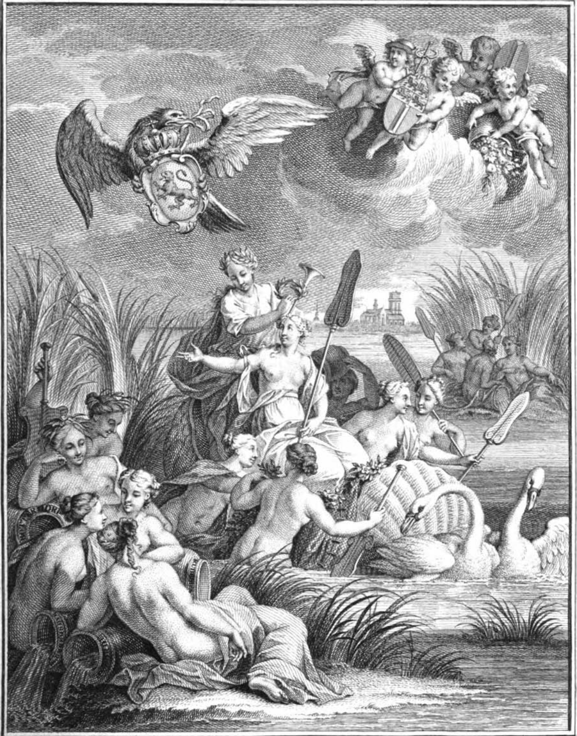
J. Paris invent. et fecit. 1747.