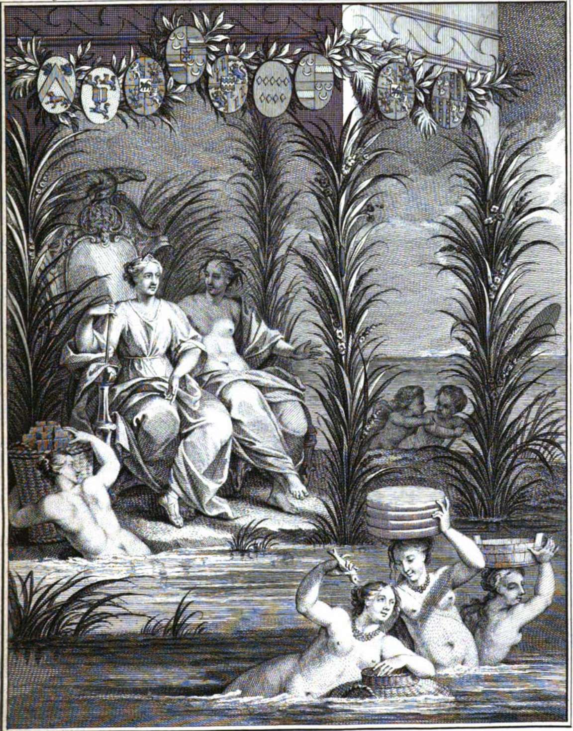
J. Punt invenit. et sculpsit. 1749.