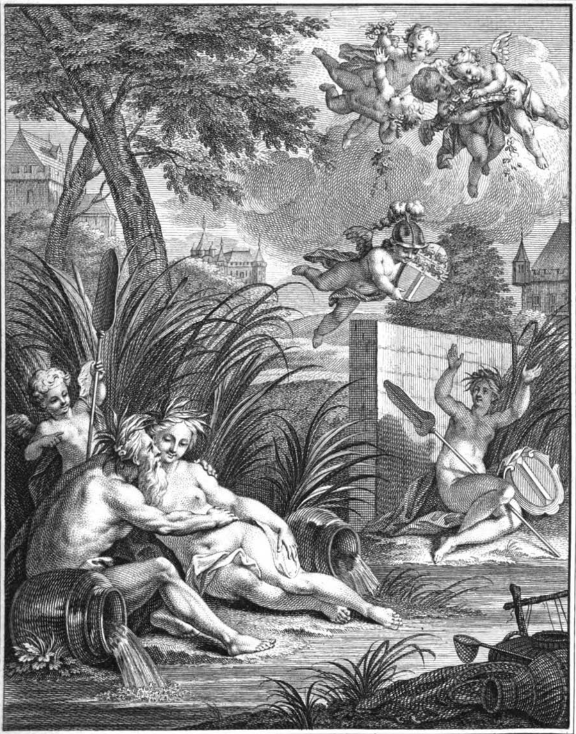
J. Dent invenit. et sculpsit. 1748.